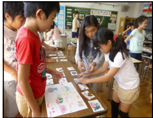
資料6 筑西グルメフェスタの様子

「筑西グルメフェスタを開こう」というタスク（課題）を設定し、模擬レストランの開店と英語による注文や接客など具体的な目的をもたせたことで、児童自身が思考し、意欲的に表現する姿が見られた。本時の活動は、中学校で身に付ける「初歩的な英語を用いて自分の考えなどを話す」ことへの円滑な接続に役立つと考える。