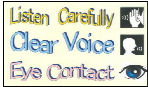
資料3 活動の3ポイント

また、インタラクティブ・アクティビティを帯活動として設定することは、毎時間、既習表現を活用する場面を継続的に確保することにつながった。取組を重ねるごとに英語を話すことに対して、生徒が抱えていた抵抗感も薄まり、英語を使って積極的に表現しようとする姿が見られるようになった。