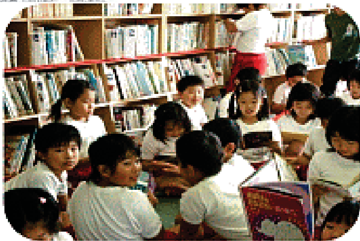
2階 読みものの部屋