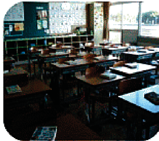
下校時の教室の様子