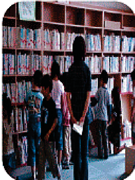
本を借りてみよう