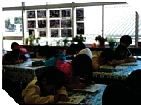
本の紹介文を書く場面