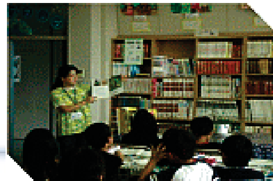
協力員によるブックトーク