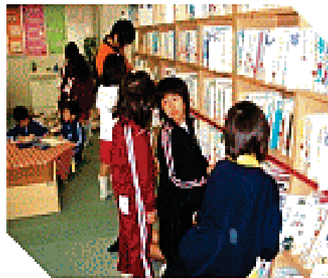
児童によるレファレンス