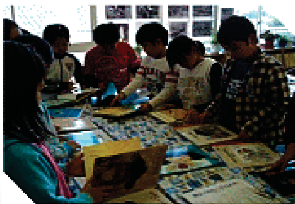
紹介したい本を選ぶ場面