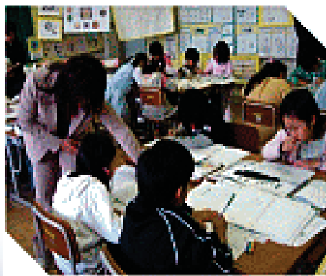
図書資料の準備と提供