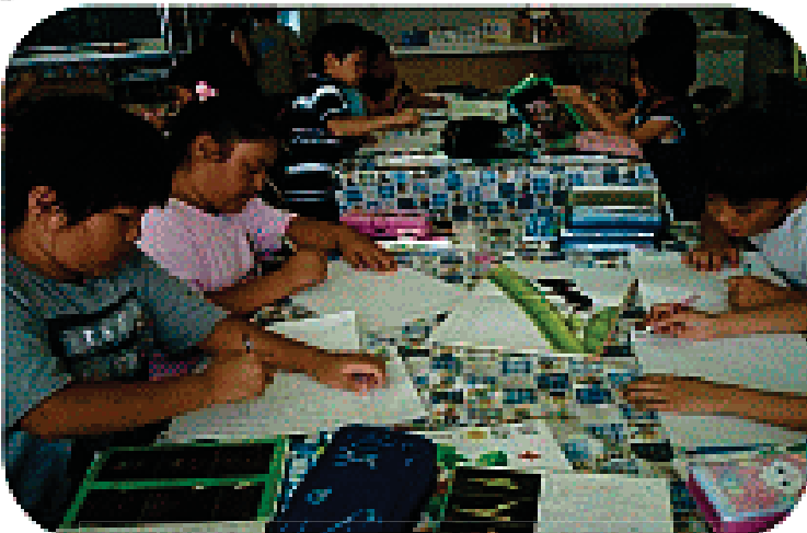
3階 調べものの部屋

図書室が2教室あるため、2階を「読みものの部屋」、3階を「調べものの部屋」とし、用途別に分けている。