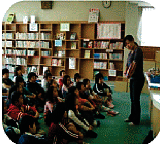
学校図書館協力員による読み聞かせ