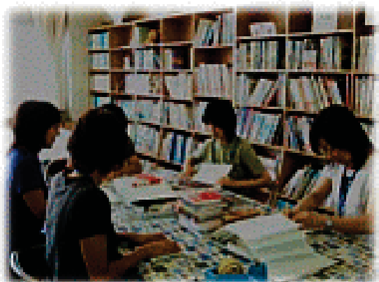
新刊図書の入作業