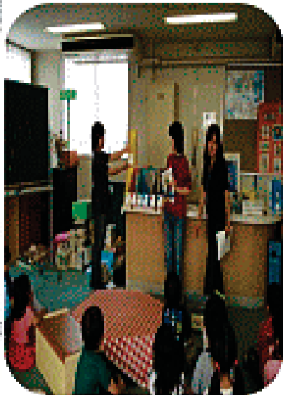
貸し出し方法の説明