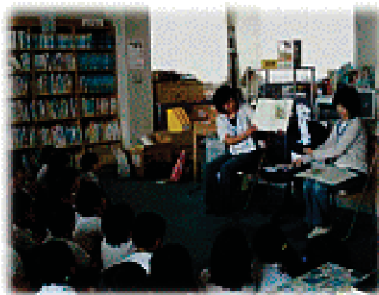
国語発展学習図書読み聞かせ