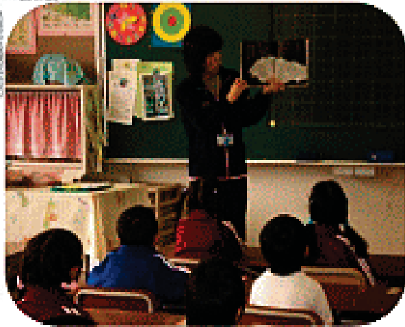
低学年 担任による読み聞かせ