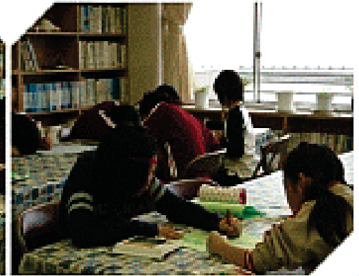
しおりづくりの様子