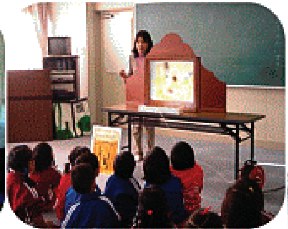
学校図書館ボランティア, 図書館司書, 市ボランティア団体によるおはなし会