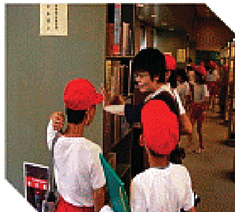
総合的な学習の時間 調べ学習