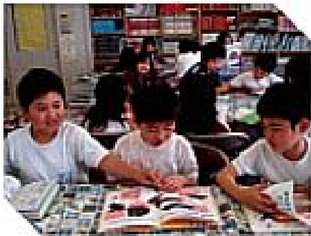
図書館利用指導計画