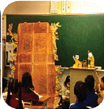
異学年交流読み聞かせ