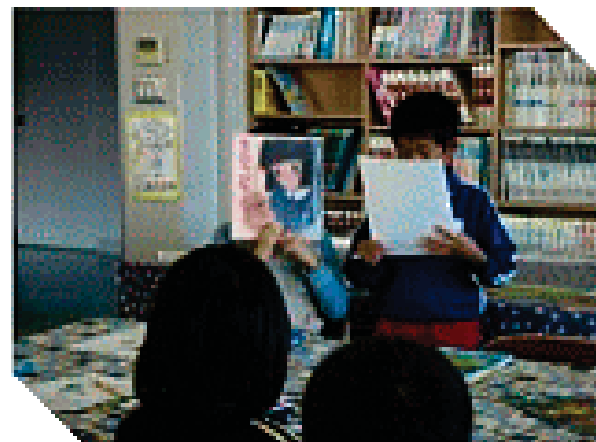
自分の読んだ本を紹介する場面