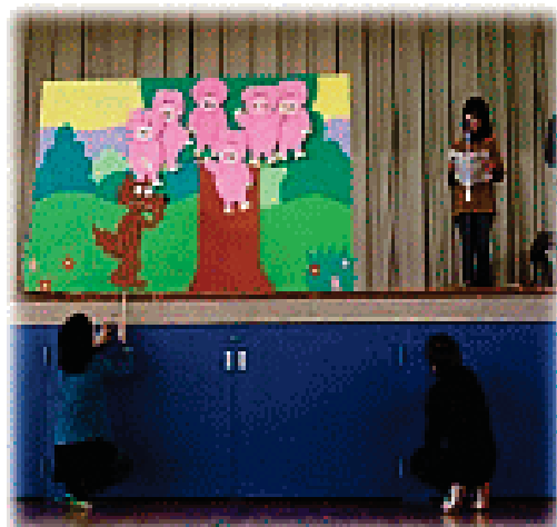
本を読もう集会での劇