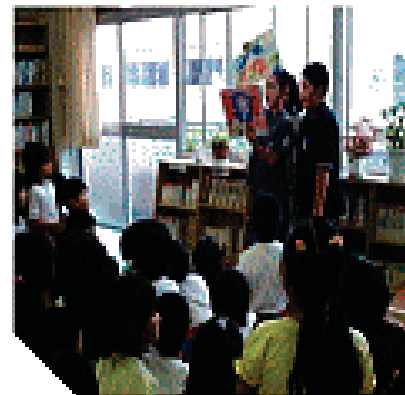
読書週間読み聞かせ