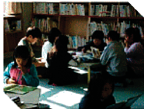
選んだ本を読む児童