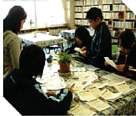
本のリクエスト集計の様子