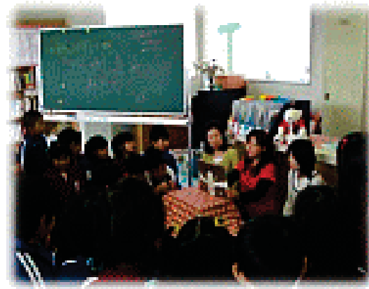
月一回の読み聞かせ